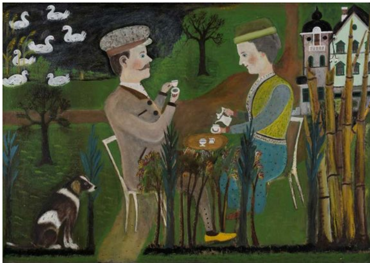
Lim-Johan, "Kaffe utan dopp".