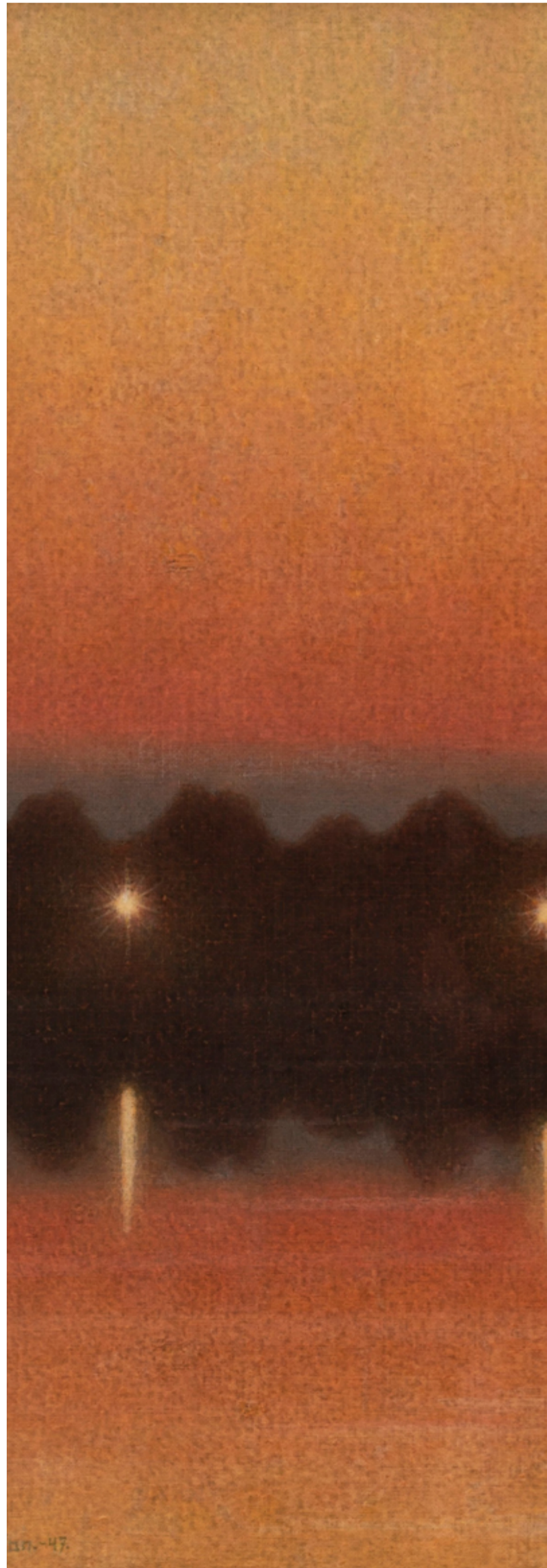
Stefan Johansson, "Sommarafton", 1947. Målningen är något beskuren.