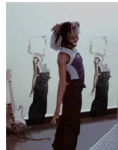
"Basically" på Bergen Kunsthall. Video: Saye Oyama, bildredigering: Salomon Leonard Poutsma.

våren ett nedslag i hans 20-åriga undersökning av intimitet, begär, motstånd och sårbarhet – inför lagen, till exempel, men också inför varandra.