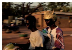
Djibril Dramé, "Sabadola zombies", 2021.