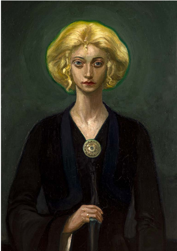
Ovan: "Porträtt av Gudrun", oljemålning 1904.