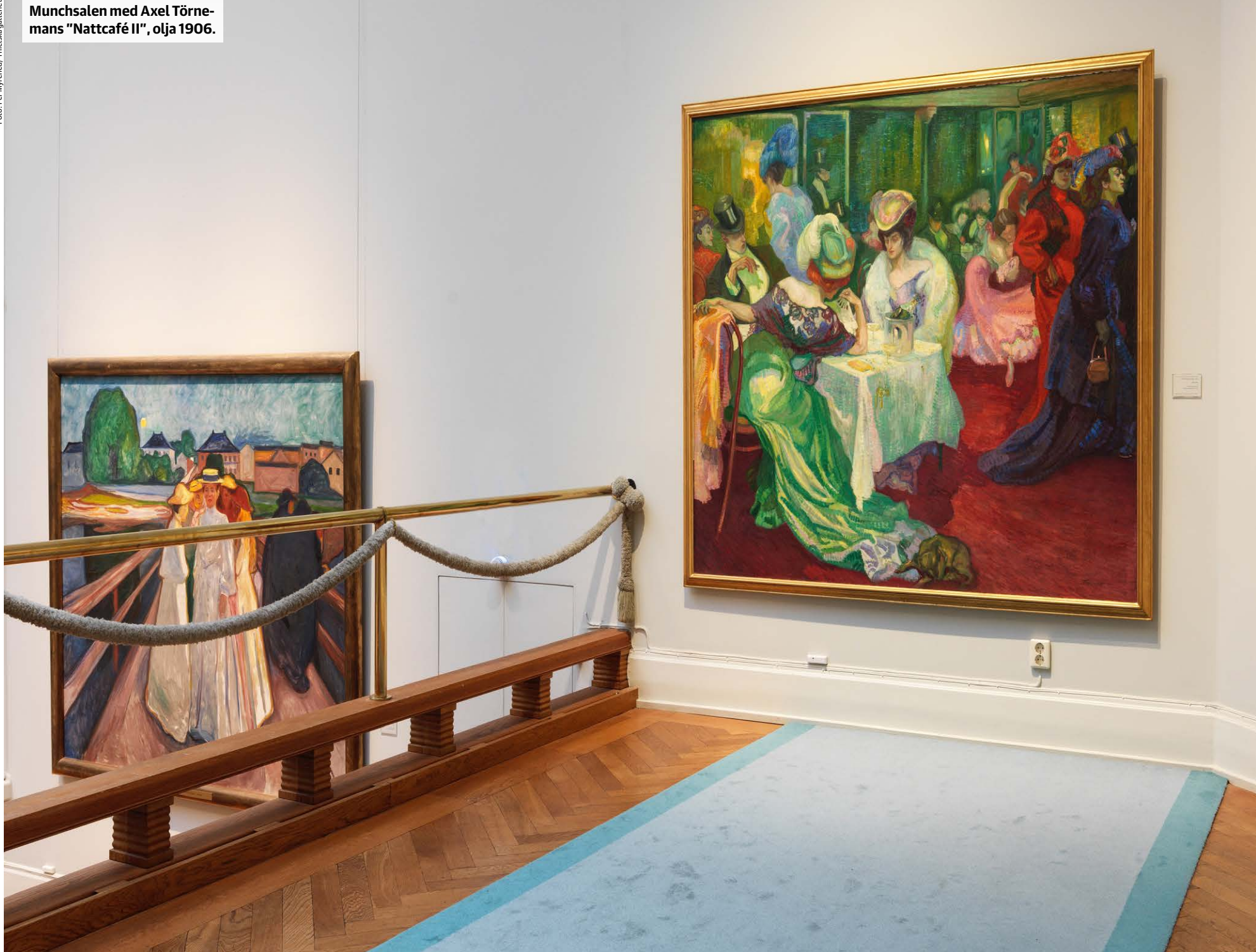
Munchsalen med Axel Törnemanns "Nattcafé II", olja 1906.