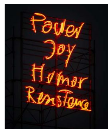
Monica Bonvicinis neonverk på Italienska kulturhusets tak.

motstånd är nyckelord när det handlar om all slags kamp för jämlikhet, och verket kan också ses som en näve höjd för Black lives matter eller den internationella hbtq-rörelsen. Här blir förstas placeringen bland ambassaderna i Diplomatstaden en effektivt förstärkande kontext.